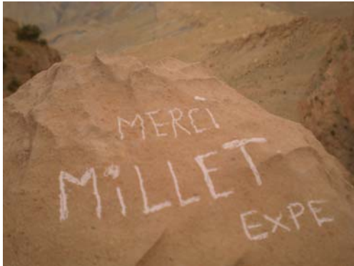
Entraide haut atlas marocain

Depuis l'ascension du premier 8000 m en 1950, Millet a toujours soutenu les grandes expéditions et complète aujourd'hui son regard sur la montagne à travers une dimension environnementale, scientifique, culturelle voire humanitaire et solidaire. 13 partenaires reconnus et complémentaires mettent leurs expériences, leurs savoir faire et leurs moyens en commun pour vous permettre de concrétiser vos projets.